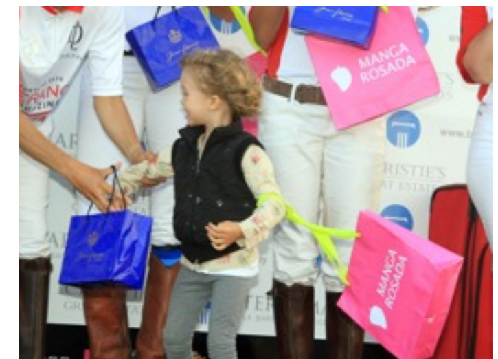
EXPOSICION DE LOGO MARCA