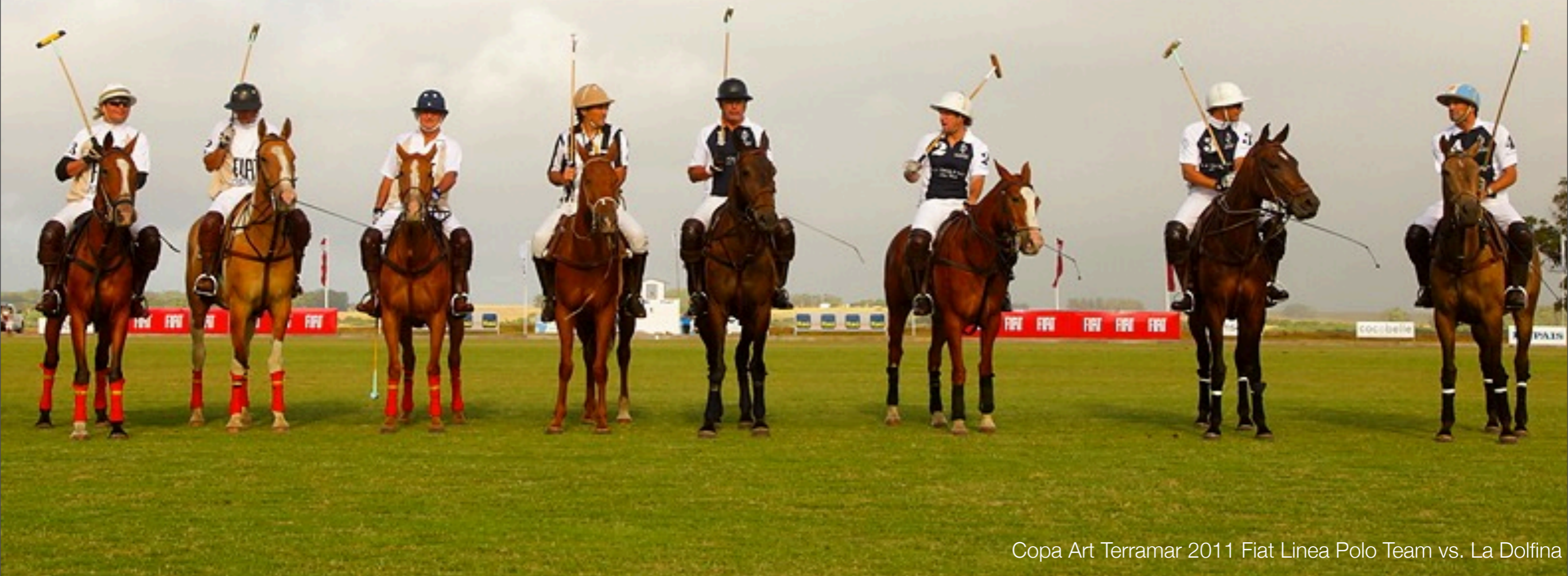
Copa Art Terramar 2011 Fiat Linea Polo Team vs. La Dolfina

JAN 4 3th TERRAMAR CHRISTIES REAL ESTATE ART CUP JAN 6 AFTER POLO PARTY